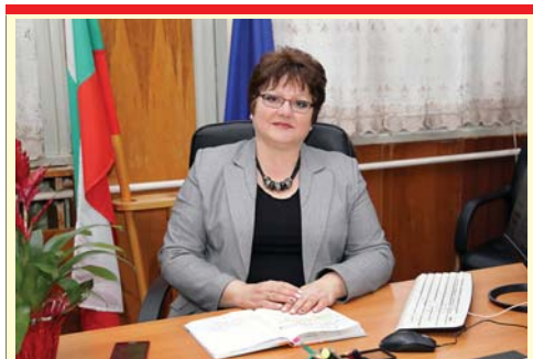
Празнувай всенародно вдъхновение! Днес всичко българско във нас зове със правото на всички поколения, със мъдростта на всички векове!